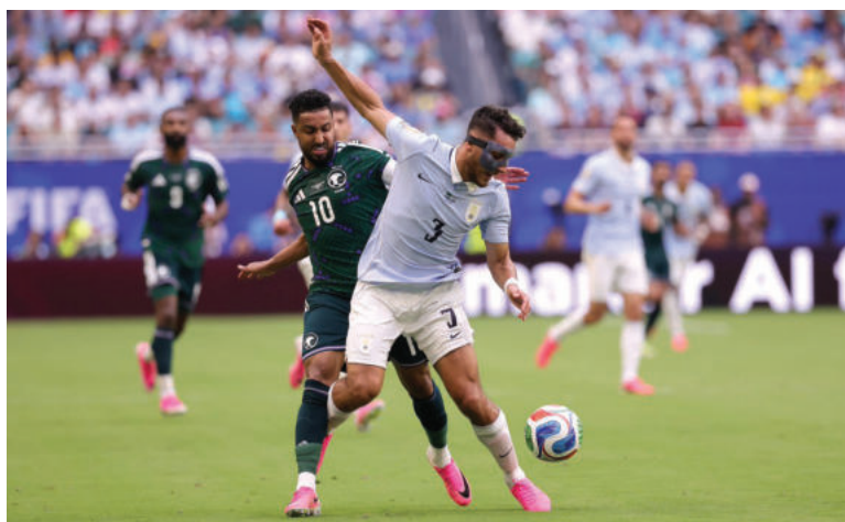
Uruguay no quiere sorpresas de Cabo Verde.