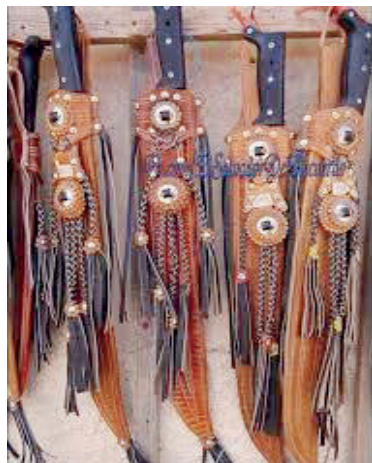
Texiguat y Cuyalí en la historia del machete.