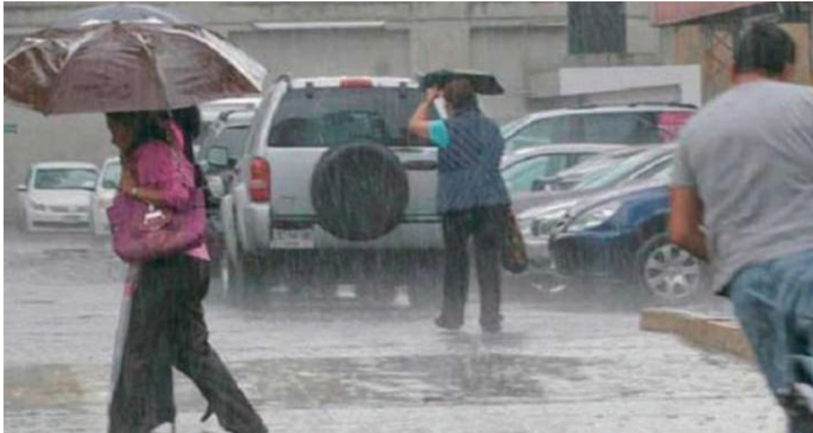
Pronosticadores de Cenaos, advirtieron del ingreso de una onda tropical que dejará lluvias en varias regiones del país.

“Para el lunes los remanentes de esta onda tropical siempre nos van a generar fuertes lluvias, pero más acentuadas en el occidente del país. Mientras que, en el resto del país, las lluvias se-