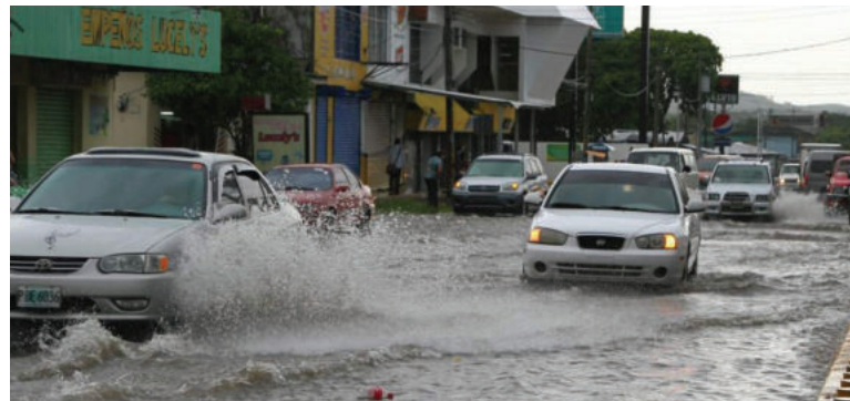
Las precipitaciones estarán dejando lluvias entre los 60 y 80 milímetros en algunos departamentos.

“Estas lluvias siempre con actividad eléctrica, es importante decirle a la población, que cuando se presenten estas descargas no deben usar aparatos eléctricos, no usen celulares, protéjense en lugares seguros, pero no bajo un árbol, tampoco cerca de una maya eléctrica o un poste de tendido eléctrico”, destacó.