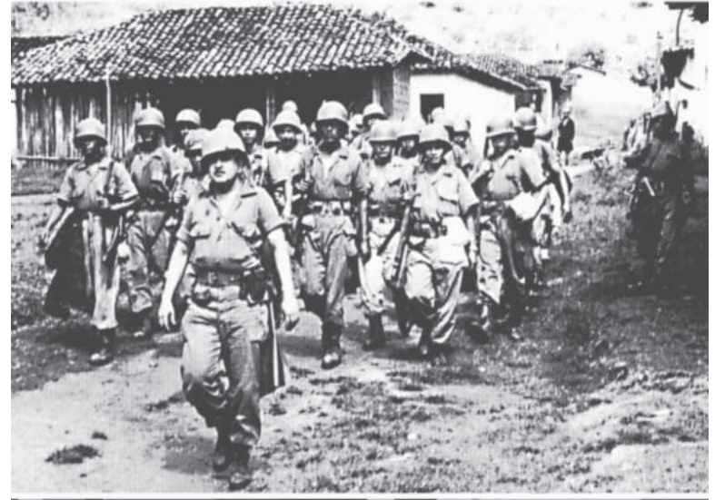
La guardia somocista incursionaba la zona.