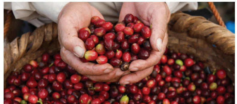
El país ha exportado 6.45 millones de sacos de café, generando más de 2,050 millones de dólares en divisas.

“El café es uno de los principales motores de la economía hondureña y una