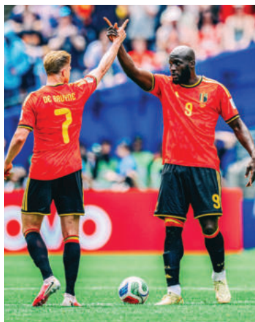
Bélgica no debería tener problemas ante la modesta Irán.