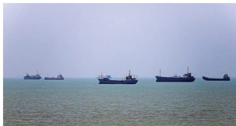
Irán había aceptado reabrir ese paso marítimo en el marco del memorando de acuerdo con Estados Unidos.

“Volvimos a nuestro pueblo hace unos días, con nuestras bolsas listas por si nos tocaba volver a irnos”, declaró el técnico de laboratorio, de 53