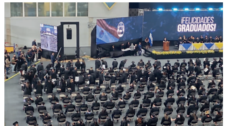
Los nuevos profesionales obtuvieron su título en diferentes áreas de la educación en presencia del rector de la Máxima Casa de Estudios.

En la nueva historia de la UNAH la oferta académica avanza, y en estas ceremonias de graduación, recibieron su título las nuevas generaciones de carreras tales como el técnico en meteorología, Técnico Universitario en Operaciones de Vuelo, licenciados en Operaciones Aeronáuticas, Técnico Universitario en Metalurgia, Maestría en Ingeniería Ambiental y doctorados en Química y Farmacia, Técnico en Alimentos y Bebidas.