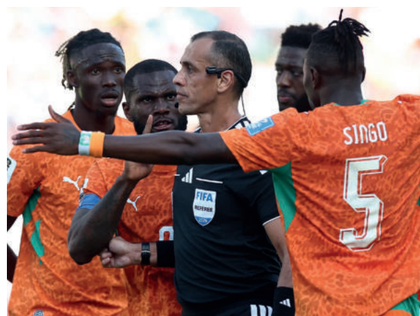
Los jugadores de Costa de Marfil reclamaron algunas jugadas donde se sintieron afectados.

Alemania se impuso 2-1 a Costa de Marfil en un trepidante partido en Toronto