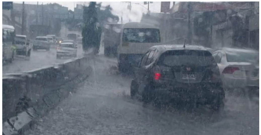
Según el pronóstico las lluvias seguirán hasta el final del mes, pero después habrá un veranillo de 45 días entre julio y agosto.