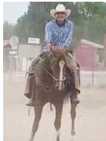
Los amansadores de potros.