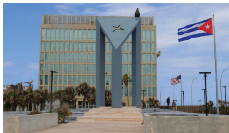
El canciller cubano comentó que EE. UU. mantiene un “plan de asfixia económica contra Cuba”.

Además, prosiguió Rodríguez, EE. UU. “chantajea y amenaza a los Estados que soberanamente mantienen acuerdos de cooperación con Cuba