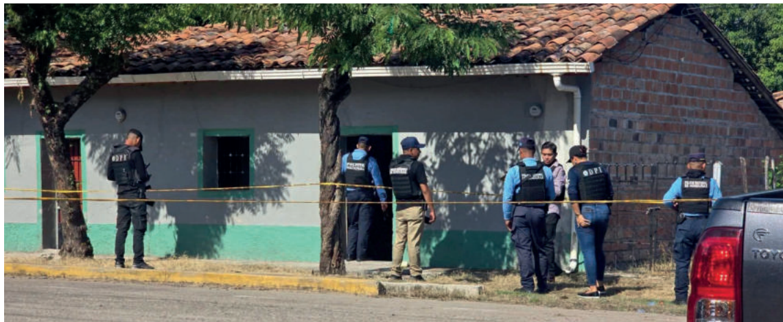
Los matones irrumpieron en la casa donde se encontraba el joven sureño.

Un hombre murió acribillado a balazos por supuestos sicarios que irrumpieron en una casa del barrio Morazán de Nacaome, departamento de Valle en la zona sur de Honduras.