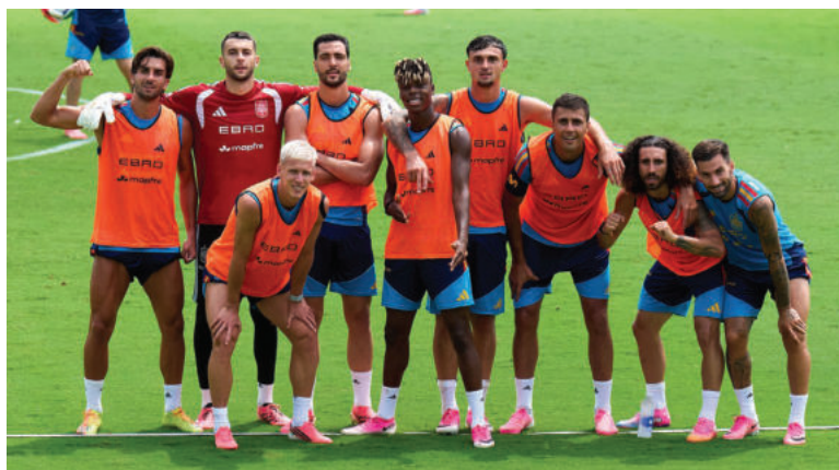
España ya no se puede permitir no ganar ante una accesible Arabia Saudita.

La selección iraní de fútbol, que considera haber sido discriminada por la administración estadounidense en este Mundial 2026, espera olvidar durante un rato sus problemas