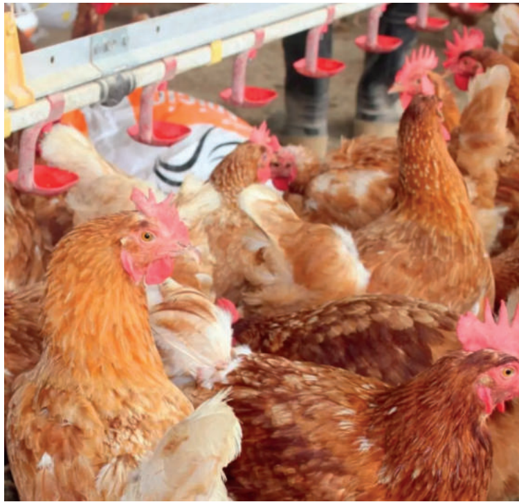
Las autoridades de Senasa confirmaron el primer caso de influenza aviar en una granja comercial y activan cuarentena.

Tras la confirmación del caso, las autoridades aseguraron que la situación se encuentra bajo control y rei-