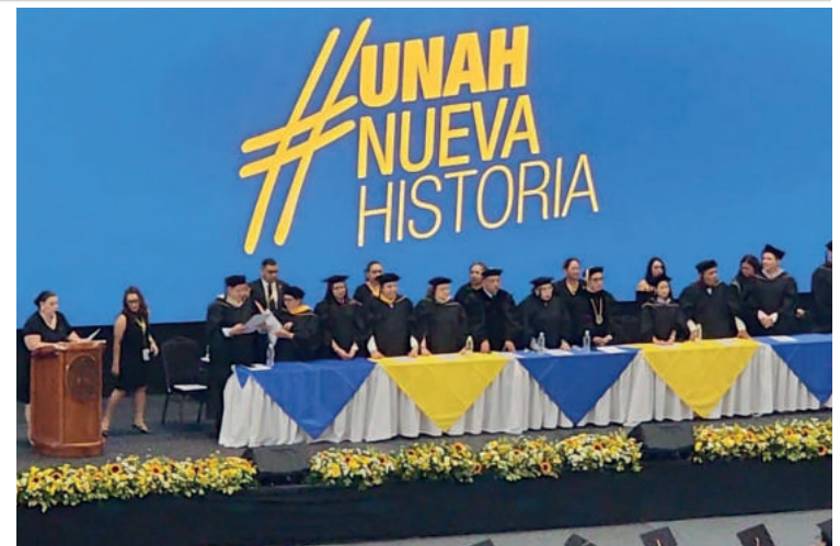
La UNAH entregó 1,054 títulos universitarios a hombres y mujeres que después de muchos años, lograron culminar sus estudios.

Hasta el momento se reporta solo un contagio y se aclaró que el consumo de carne de pollo y huevos es seguro.