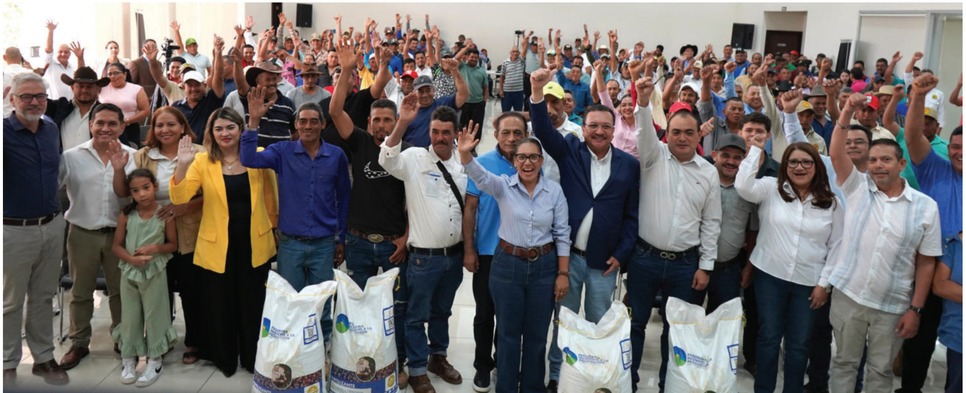
La cobertura del programa alcanzará al 94% del total de productores inscritos en el registro del Ihcafé.