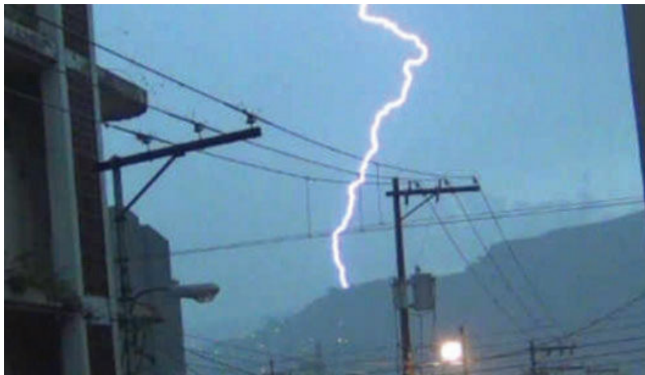
Las lluvias de hoy y mañana estarán acompañadas de actividad eléctrica, advirtieron los expertos.

El pronosticador aclaró que en el mes de julio y agosto se tendrá una canícula muy severa y extendida de 45 días, en cual habrá lluvias, pero muy deficitarias.