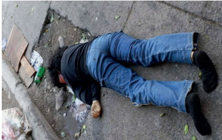
Con este nuevo feminicidio, suman alrededor de 130 mujeres asesinadas en el 2026 con un 98% de impunidad.

Elementos de la Policía Nacional se desplazaron de inmediato para acordonar la escena del crimen y recolectar evidencias, mientras personal de Medicina Forense procedió al levantamiento cadavérico.