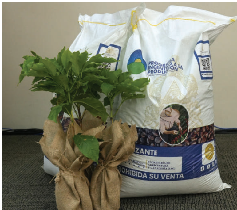
La iniciativa busca fortalecer la competitividad del sector cafetalero nacional mediante la entrega directa de insumos agrícolas.